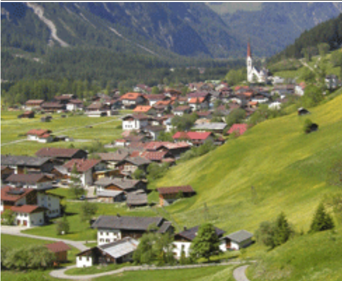
Autor Michael Kohler Quelle Tourismusverband Lechtal